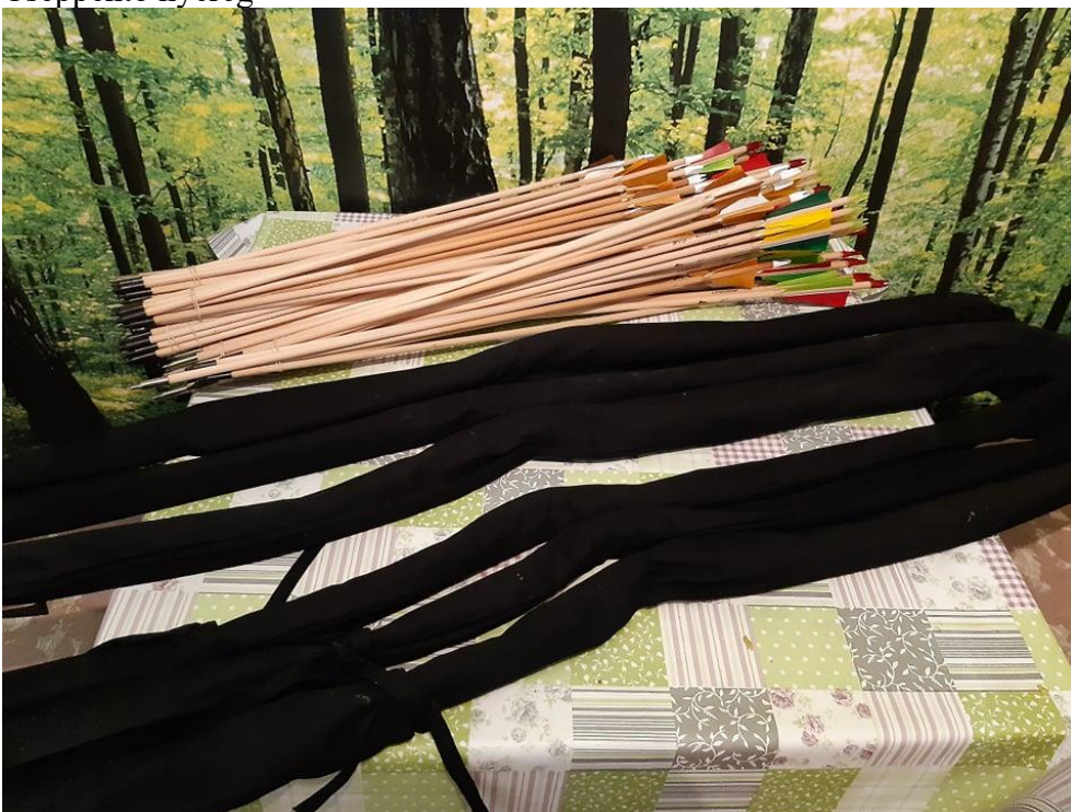
Íjak és nyílveszők